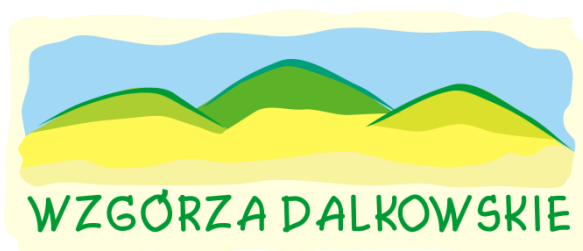
Fundacja "Porozumienie Wzgórz Dalkowskich"