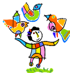
Stowarzyszenie Pomocy Dzieciom i Młodzieży